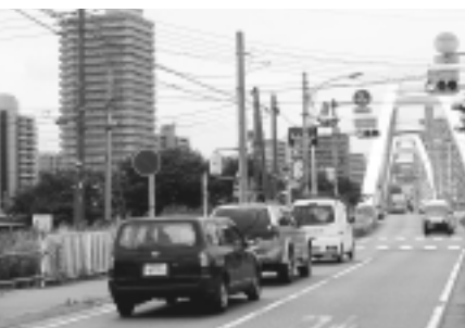
朝、夕は深刻な渋滞が...

答（建設部長）：あゆみ橋に接続している市道の中で、相模川河川改修・さがみ縦貫道路により影響となる路線について