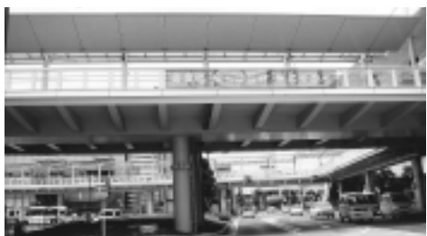
現在は横断幕でPRを実施中

問：市では、犯罪抑止のために、自動販売機にテロップで、情報の発信を行っています。県下何力所かで大型電光掲示板による情