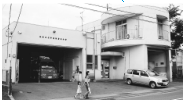
早期建てかえが望まれる消防署北分署

問：消防北分署の耐震診断の結果は、指標値の半分以上しかなく、緊急に建てかえ整備を考えたうえに、東柏ヶ谷地区には、62棟の高層マンションが存在しており、はしご車の配備が要求されています。しかし、現在の敷地面積では不可能な状況です。広い土地に移転すべきと考えますが、市長の見解を伺います。