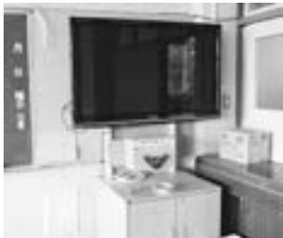
▲電子黒板で充実した授業が受けられる

答（教育部次長）：本市では、小学校外国語活動の全面実施に先駆け、21年度から小学校5・6年生で年