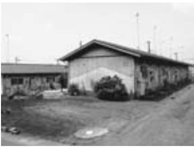
▲築45年が経過した杉久保市営住宅地