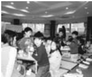
▲子どもの健やかな育ちを支援するために

問：6月から子ども手当月額1万3000円の支給が開始されます。国は当初、所得税の扶養控除と配偶者控除を見直し、その財源を確保するとしていましたが、確保できずに地方自治体が負担する結果となりました。不要となるはずの児童手当で独自事業に当てられる予算が国の都合で政策転換せざるを得なくなった事をどう考えるか伺います。 答（市長）：子ども手当の支給については、議員ご指摘のとおり国が全額負担して実施するはずでしたが、