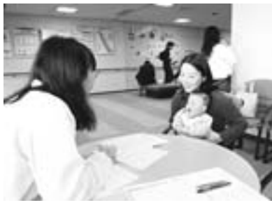
▲効果の高い予防接種に公費助成を

答（市長）：予防接種は、伝染の恐れがある病気の発生や社会流行を防ぎ、重要なものであると認識しています。現在、予防接種法に基づかない予防接種は「任意の予防接種」となり、個人の判断のもとで病院や診療所で実施しています。ご指摘のとおり一部の自治体において、任意の予防接種に対して費用の助成を行っているところもありますが、