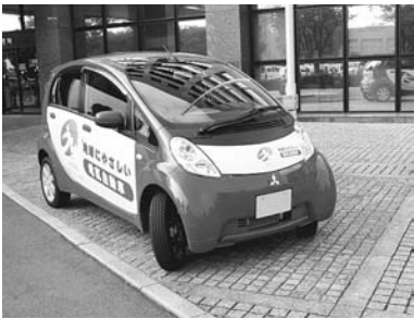
▲地球にやさしい電気自動車

▽ハードの事業では、さがみ縦貫道路海老名インター開通に伴うアクセス道路の整備や海老名駅自由通路整備への取り組み、小学校空調設備の導入や生命と財産を守る消防署北分署の建設事業などを高く評価します。