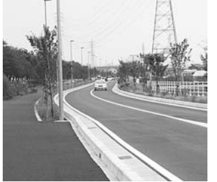
▲インターへのアクセスが便利に中新田鍛冶返線

▽海老名駅自由通路の建設推進、さがみ縦貫道路海老名インターの供用開始、消防署北分署の建設など事業を結実させたことを評価します。▽歳入について、市