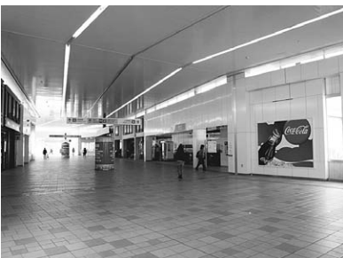
明るく広くなった自由通路

評価します。▽しかし、市税が3年連続減少している中で、大型事業が継続して実施されていることは、過去の他市の例を見ると心配な側面もある。財政指標県内トップクラスの海老名市においては杞憂に終わることを願います。▽下水道事業特別会計以外の4特別会計については、社会保障と税の一体改革以外に抜本的解消はなく、基本的方策と高齢社会に対する真剣な対応を国に対し求めることを要望します。