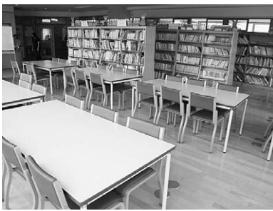
豊かな人間性を育む学校図書館

答（教育長）：自ら学び、考え、課題を解決する力や豊かな人間性などの生きる力を身に付ける必要がある時代において、読書活動は