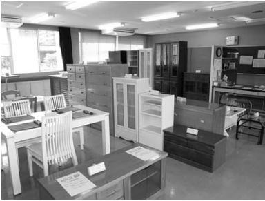
粗大ゴミだったとは思えない再生家具

現在、市では、ごみ減量化、資源リサイクルの理解を深めるため出前講座や小学校サマースクールでの教室、リサイクルプラザでの各種教室を実施し、たくさんの