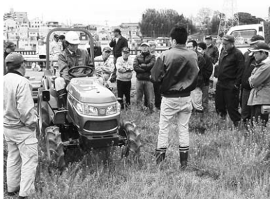
多くの農家の方が操作講習を受講

員を中心に貸出管理業務を行っています。利用に際しては講習会の参加を義務付け、電話予約にて貸し出しをしています。利用実績は、トラクターが3ヶ月間で延べ20人が利用し、田畑合わせて6万2500平方メートルを耕しました。田植機は5月26日から貸し出しを開始し、予約も含め13人を