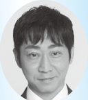
不登校支援についてなど 公明党 星 伸一

問 より重層的な学びの保証・学習機会の確保・選択肢として、フリースクールなどの活用について伺います。