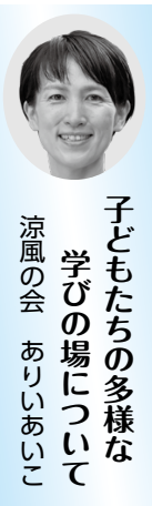
子どもたちの多様な学びの場について 涼風の会 ありあけこ

問 多様な子どもたちの多様な学びの場を確保するための受け皿として、すでにある民間のフリースクールとの連携を強化していくことや、さらに市内に増やすことについて見解を伺います。