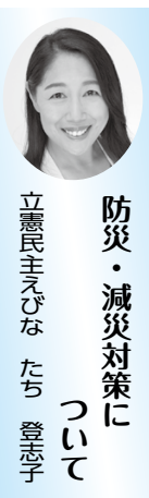
防災・減災対策について 立憲民主えびな たち 登志子